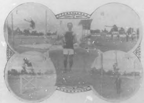
1. París.—Primer premio. Salto de altura sin trampolín; saltó 1 metro 80 centímetros. 2. París.—Con la copa de Regularidad. 3. París.—Primer premio. Salto de longitud; alcanzó en el salto 6 metros 62 centímetros. 4. París.—Primer premio en carrera pedestre y salto de haya. En las carreras de velocidad recorrió la distancia de 100 metros, en 10 segundos dos quintos. 5. París.—Segundo premio. Salto de pértiga. 2 metros 81 centímetros.