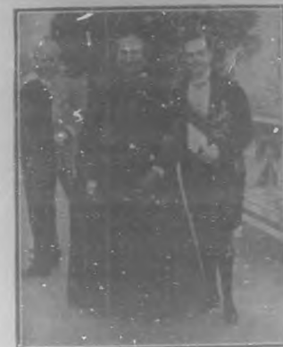
El Rey Manuel y el Patriarca de Lisboa, cardenal Neto que ofició en la ceremonia nupcial.

que se adjudica una vez al año al atleta que tomando parte en todos los concursos que se celebran en un mismo día, queda en todos ellos mejor clasificado. Esa ha sido la labor y el triunfo conquistado por Enrique Peris en el extranjero, dejando que figure el nombre de Cuba en primer lugar, venciendo á todos los competidores de distintas nacionalidades, considerados, como decimos antes, verdaderos campeones, pues con ese título, son solo los que pueden optar para la conquista de tan valioso premio.