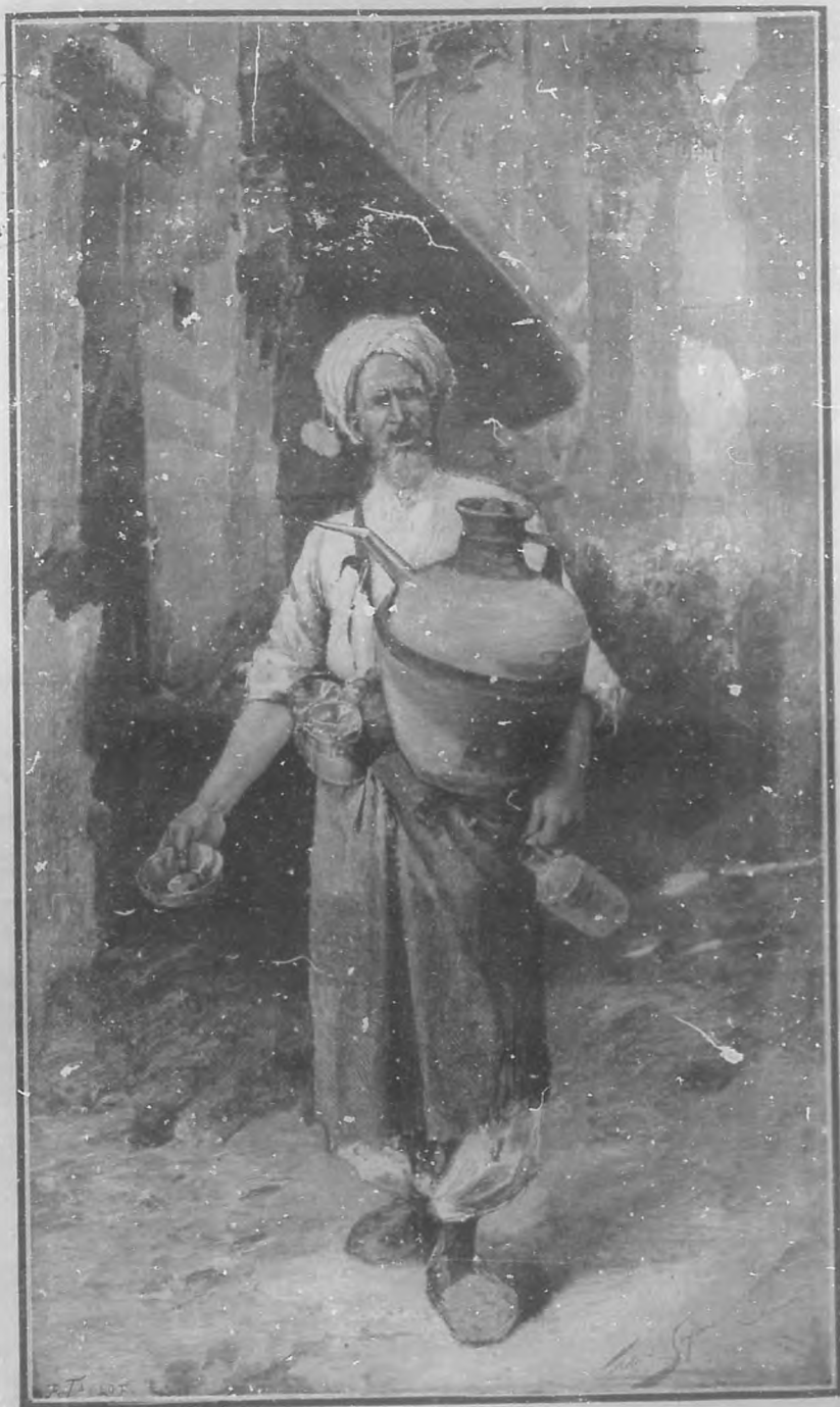
Vendedor de refrescos en el Cairo, cuadro por J. Seymour.—(Bicolor Lacalle.)