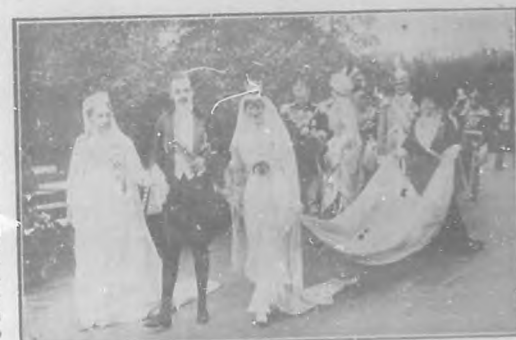
El Rey Don Manuel, la Princesa Eugenia, la gran Duquesa de Baden y el acompañamiento en la terraza del castillo de Sigmaringen.

Próximamente comenzaremos á cumplir lo antes ofrecido.