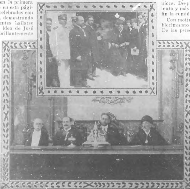
EN LA UNIVERSIDAD. Distinguido grupo compuesto por el señor Presidente de la República, el Dr. Bernal, el señor Secretario de Instrucción Pública y otras distinguidas personalidades. — Presidencia del solemne acto de apertura del curso universitario.

Expléndida fiesta. — Solemnemente se ha celebrado la fiesta patronal en el Hospital "Mercedes". Todos los años este benéfico establecimiento dedica á la Virgen de las Mercedes un tributo de reconocimiento piadoso por su tutela y amparo. Para la función religiosa se engalanó con gusto exquisito el templo, y en las salas lucían primorosos decorados, sobresaliendo entre todas las de "San Vicente" y "Santa Magdalena".