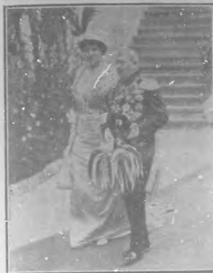
La gentilísima Reina Amelia, madre de Don Manuel y el Príncipe William de Hohenzollern.

Boda real.—Ha constituido una nota de actualidad palpitante el matrimonio del ex-rey de Portugal Don Manuel de Braganza y la princesa Agustina Victoria de Hohenzollern verificada en el castillo de Sigmaringen (Alemania), y á la que han concurrido numerosos personajes políticos portugueses, que siguen al ex-soberano de su país desde que fué expulsado del trono por los republicanos. Han hecho interesantísima esta boda los acontecimientos de solapada y febril revuelta de los monárquicos lusos, coincidentes con el día de la celebración del acto nupcial á que ha contribuido á dar relieve la actitud temerosa del gobierno, á quien va faltando base y solidez cada día, lo que hace pensar en la posibilidad próxima de la restauración del trono.