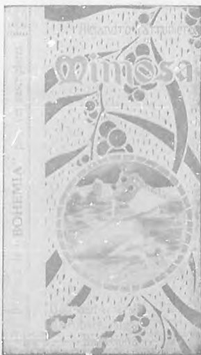
Fascimil de la novela "Mimosa" que regala "Bohemia" a sus abonados en el presente mes de octubre.